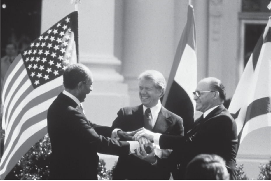
أنور السادات وجيمي كارتر ومناحم بيجين في البيت الأبيض لتوقيع معاهدة السلام بين مصر وإسرائيل، مارس 1979

مع التسليم بقدرة الاتصال على إحداث التغيير في الدول وممثليها الذين يقومون بالاتصال والتي أبرزتها الحالة المصرية الإسرائيلية فإن المرء يعتقد أن الاتصال باعتباره شكلاً حديثاً وواسعاً للتفاوض - يضم كل الأنشطة المحورية للدبلوماسية، وقد يثار تساؤل عن أشكال التمثيل والتي لا يمكن اعتبارها في حد ذاتها أفعالاً تواصلية، فعلى سبيل المثال أليس إرسال بعثة دبلوماسية دائمة لافتتاح سفارة في حد ذاته اتصالاً بالدولة المضيئة؟ وفي حين قد يبدو حقيقياً أن أي فعل من أفعال التمثيل يجسد مكوناً تواصلياً، فإنه ليس من المنطقي النزول بدراسة الدبلوماسية إلى مرتبة فرع من دراسة الاتصال أو نعتبرها مجرد مجموعة من الإشارات، ولأن دراسة الدبلوماسية تركز على كيفية تفاعل الدول مع بعضها البعض من خلال ممثليها، فإن الوظيفة الأساسية لكثير من الأنشطة الدبلوماسية هي في الأصل تمثيلية أكثر منها تواصلية في طبيعتها، فاخترار وزير للتجارة واختيار قائمة للطعام وخطة للجلوس في حفلة عشاء وتنظيم الواجبات